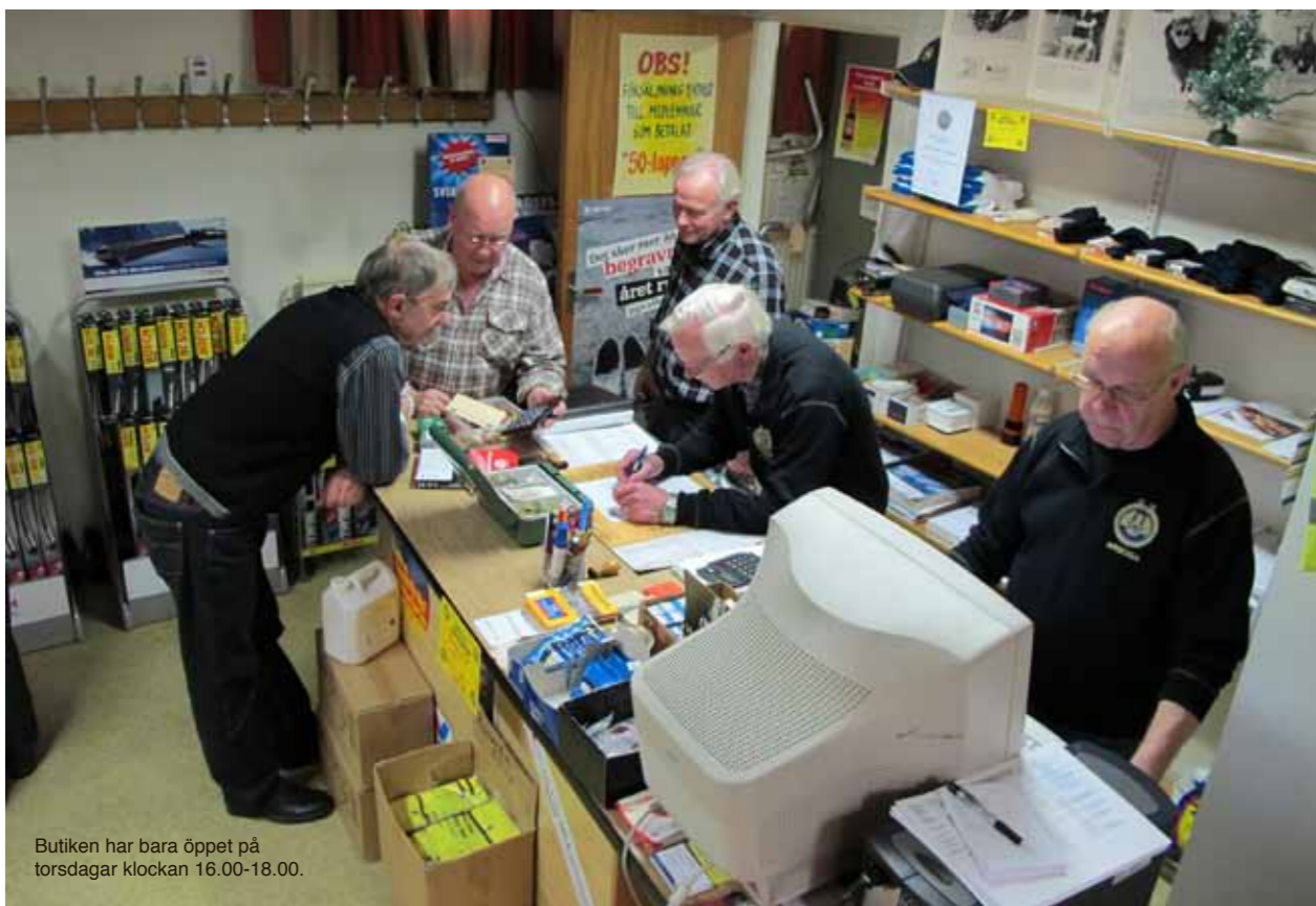
Butiken har bara öppet på torsdagar klockan 16.00-18.00.