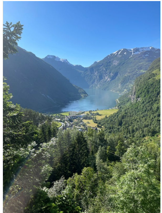
Vi andra tog en kall öl och tittade på den fina utsikten.