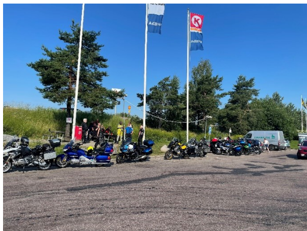
Dag 1, Samling vid pumpen i Enköping.