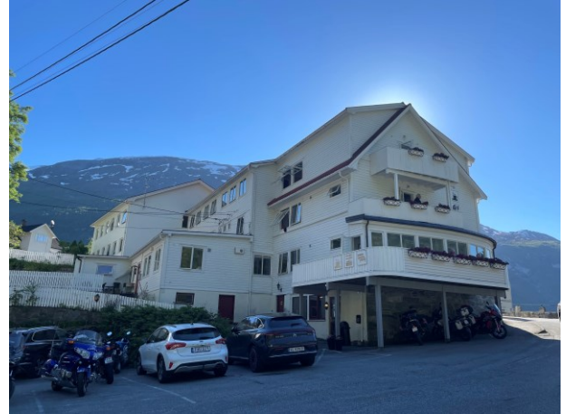
Skönt att vara framme vid hotell Utsikten i Geiranger.