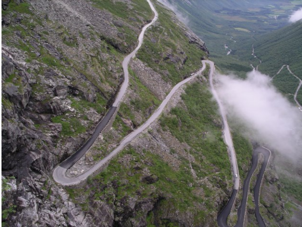
Trollstigen sedd uppifrån utkiksplatsen (äldre bild).