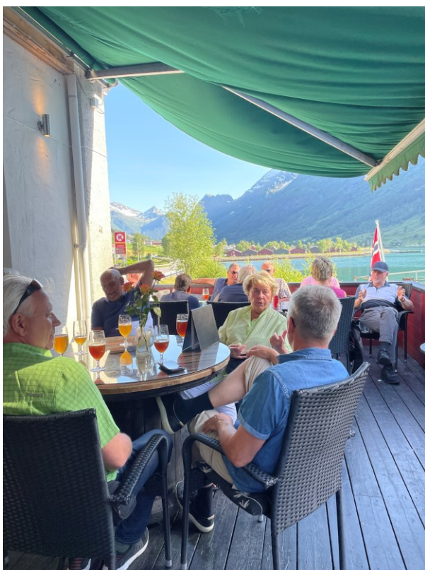
Återigen en finfin dag och fin avslutning på dagen.