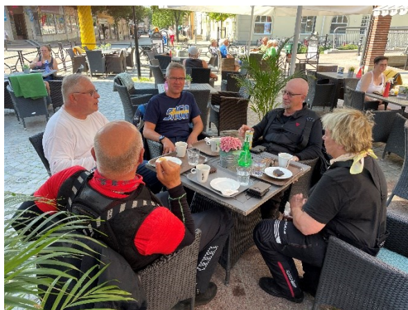
Bergslagens konditori i Ludvika, äntligen fika. Förmodligen sista finfikat innan vi är tillbaka i Sverige.