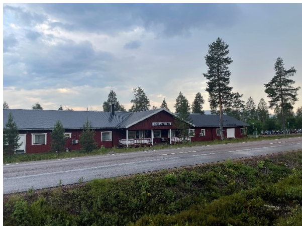
Efter en lång dag och några borttappade kompisar som var under inlärnin i körsätt "öppen grupp", var vi nu alla samlade för kvällens grillning och eftersnack i Sälens vandrarhem.